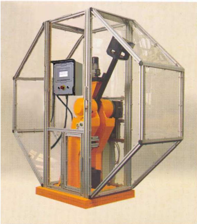
Pendolo PM001/A con gabbia di protezione in profilati di alluminio e pannelli in Lexan