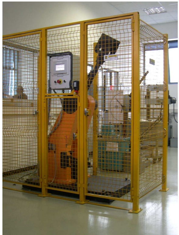
Pendolo PM001/A con gabbia di protezione in rete metallica elettrosaldata